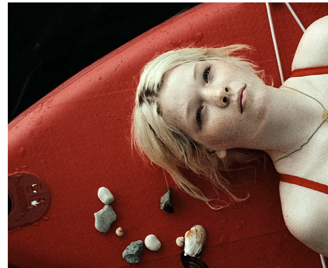
Žvelgiant į saulę