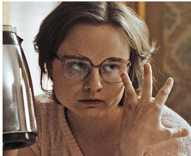
In die Sonne schauen

Der neueste Film von Giedrė Žickytė ist eine Hommage an diese herausragende Persönlichkeit der litauischen Kultur. Er ist nicht nur ein historisches Zeugnis eines für immer verlorenen Litauens, sondern auch eine hoffnungsvolle Erinnerung daran, wie die eigene Haltung die Welt verändern kann, und zugleich eine Einladung.