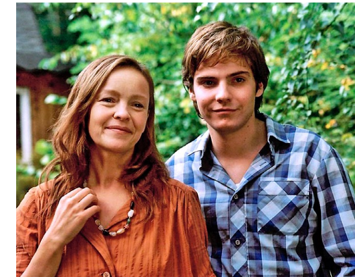
Good Bye, Lenin!