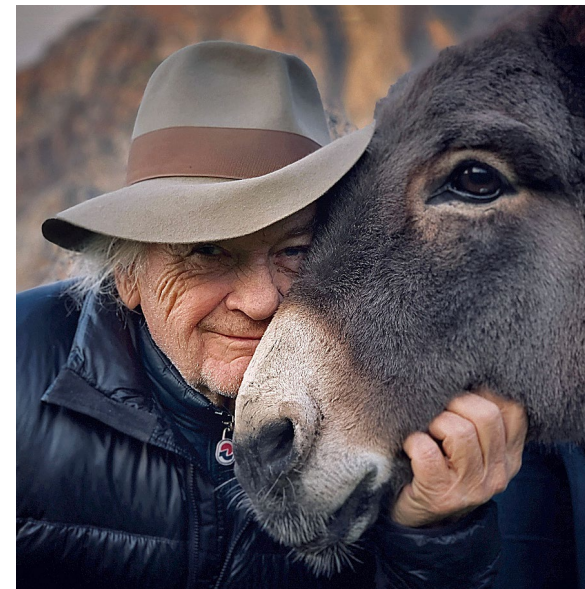
Režisierius Jerzy Skolimowski

Šešiasdešimtmetė valytoja Emė Kurovski užsieniečių užėjoje slepiasi nuo lietaus. Čia ji susipažįsta su dvidešimt metų jaunesniu marokiečiu Ali. Netrukus Ali atsikrausto pas Emę gyventi, ir jie susituokia. Jie laimingi, tačiau poros draugai ir šeimos nepritaria jų ryšiui. Raineris Werneris Fassbinderis meistriškai naudoja klasikinės Holivudo melodramos emociniu krūviu, kad atskleistų rasines įtampas, slypinčias šiuolaikinėje Vokietijos visuomenėje.