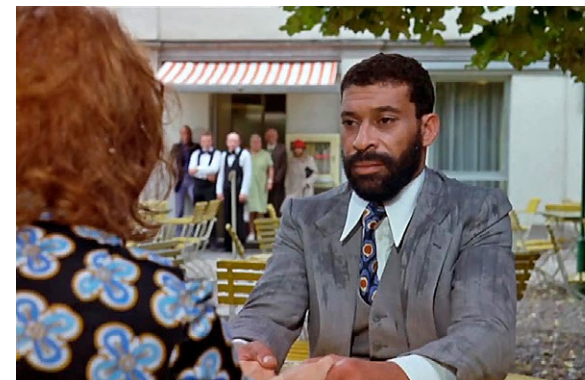
Angst essen Seele auf

Der Film von Christian Petzold wurde 2018 im Wettbewerb der Berlinale präsentiert und hat angesichts des anhaltenden Krieges in Europa wieder an Aktualität gewonnen. Die Hauptfigur des Films, Georg, ist ein deutscher KZ-Flüchtling, der sich in Paris vor den Faschisten versteckt. Seine Ruhe währt jedoch nicht lange, denn nach der Besetzung der Stadt beginnen Razzien und Säuberungen. Für die verfolgten Flüchtlinge bleibt als einziger Ausweg ein Transitvisum, mit dem sie von Marseille aus über den Atlantik fliehen könnten. Georg erhält die Chance, dieses Visum zu bekommen, allerdings muss er dafür einige Briefe an einen regierungskritischen Schriftsteller in einem Hotel überbringen. Der Regisseur versetzt in seiner Verfilmung des berühmten Romans von Anna Seghers den Zweiten Weltkrieg in das heutige Marseille und erzählt eine geheimnisvolle Geschichte im Stil des Film Noir.