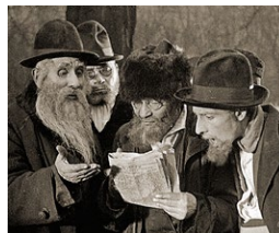
Miestas be žydų