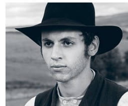
Kita Tėvynė – ilgesio kronika