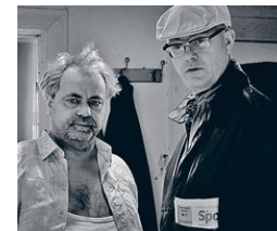
Von Hunden und Pferden