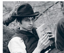
Die andere Heimat