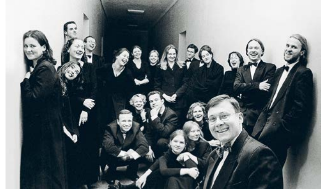
Kamerinis choras Aidija